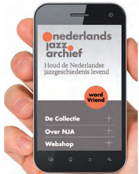
Het Jazzportal wordt medio 2016 gelanceerd