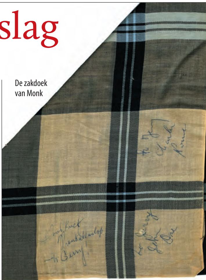
De zakdoek van Monk

Het Nederlands Jazz Archief heeft sinds de overheidsbezuinigingen veel activiteiten in gang gezet om zijn voortbestaan financieel veilig te stellen. Langzamerhand komt het einde van deze doorstartfase in zicht. Bestuur en bureau werkten in 2015 intensief aan (financiële) continuïteit en stabiliteit van de NJA-kernactiviteiten. Het jaar stond in het teken van werk in uitvoering. 'De dingen die we doen, doen we goed'.